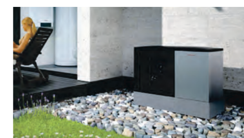
Aussen - Einheit Flüsterleise