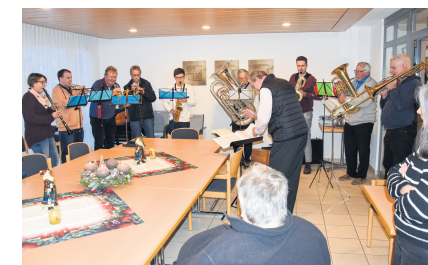
Weihnachtskonzert für Spitex-Klienten.

Gemeinsam mit dem Verein Musik Stettfurt-Matzingen und der Musikgesellschaft Thundorf organisierte die Spitex Matzingen Stettfurt Thundorf Adventskonzerte für Spitex-Klienten. Die Spitex legt grossen Wert auf die ganzheitliche Pflege ihrer Klienten. Aus diesem Grund wurden musikalische Partner gesucht, welche die Spitex in der Adventszeit bei der seelischen Spitex-Pflege unterstützen. Beide Musikvereine liessen sich spontan von der Idee begeistern. «Die meisten Spitex-Klienten sind auch