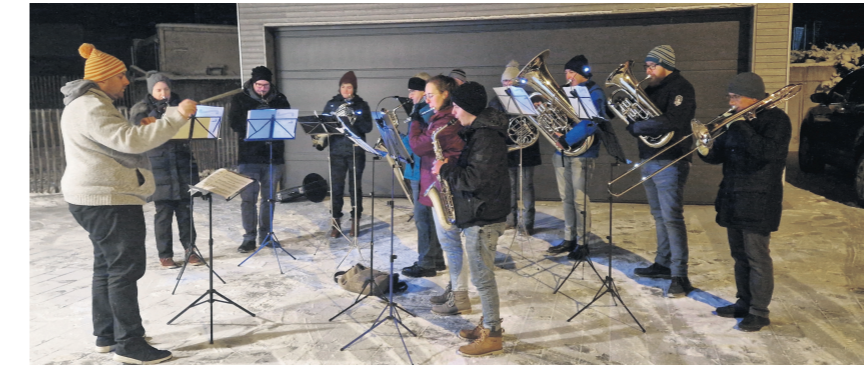
Spitex und Musikvereine überraschen Klienten mit Adventskonzert. (Archivbild)

Gemeinsam mit der Musik Stettfurt-Matzingen und der Musikgesellschaft Thundorf organisiert die Spitex Matzingen Stettfurt Thundorf Adventskonzerte für Spitex-Klienten. Die Spitex legt grossen Wert auf die ganzheitliche Pflege ihrer Klienten. Aus diesem Grund unterstützen die Musikvereine die Spitex in der Adventszeit bei der seelischen Spitex-Pflege. Das Projekt wird dieses Jahr bereits zum zweiten Mal durchgeführt. Eine beschenkte Spitex-Klientin sagte: «Das ist eine wunderbare Überraschung in dieser dunklen Jahreszeit.» Mit festlichen Weihnachtsliedern er-