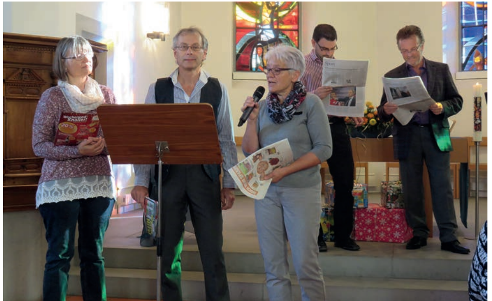
Das Team vom Laiengottesdienst 2015

Jeweils am zweiten Sonntag im November findet in vielen Evangelischen Thurgauer Kirchgemeinden der Laiensonntag statt. Anstelle der Pfarrperson gestalten Mitglieder der Kirchgemeinde den Gottesdienst – so auch in Matzingen am vergangenen Sonntag.